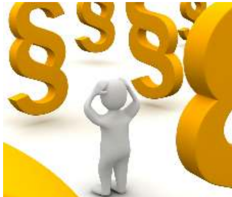
Die DPVKOM hilft bei rechtlichen Fragen und Problemen.

Dabei erstrecken sich die Rechtsberatung und der Rechtsschutz der DPVKOM auf das Arbeits- und Sozialrecht sowie das Beamten-