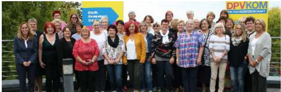
Teilnehmerinnen des Bundesfrauentages 2019.

Bei der DPVKOM haben die Jugend, die Senioren und die Frauen eigene Vertretungen. Diese kümmern sich ganz speziell um die Belange der jeweiligen Zielgruppe und richten ihre Gewerkschaftsarbeit an deren