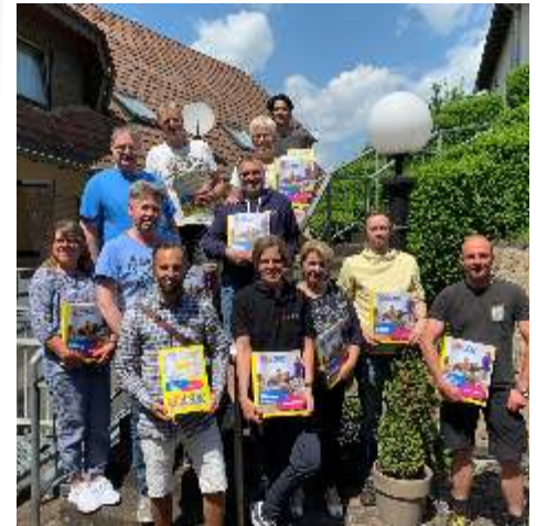
Die Schulungen und Seminare der DPVKOM vermitteln eine Menge Wissen und machen Spaß.

Eine Vielzahl an Schulungen bietet die DPVKOM auch ihren Betriebsräten an. Zahlreiche Grund-