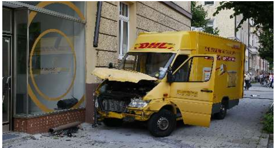
Ein mit dem Dienstfahrzeug verursachter Schaden kann für den Beschäftigten teuer werden.

Das heißt: Wenn Sie einen Schaden an Ihrem Dienstfahrzeug oder Dienstfahrrad verursachen und Ihr Arbeitgeber hierfür Schadensersatzforderungen geltend macht, dann brauchen Sie nichts zu befürchten. Die DPVKOM schützt Sie im Fall der Fälle. Wir helfen Ihnen auch dann, wenn Sie fremdes Eigentum beschädigen und der Arbeitgeber Sie hierfür zur Kasse bittet. Auch hier sind Schäden bis zu einer Höhe von 150.000 Euro je Schadensfall versichert. Dieser Schutz gilt auch für Dienstfahrten mit dem