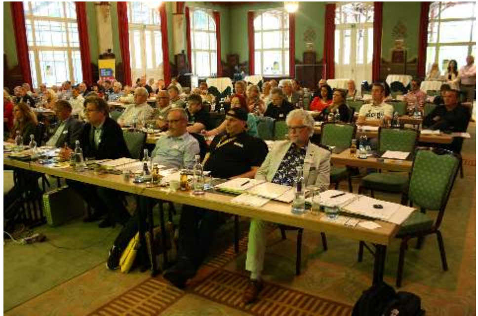
Delegierte des Gewerkschaftstages.

Das oberste Organ der DPVKOM ist der alle fünf Jahre stattfindende Gewerkschaftstag. Dieser legt unter anderem die Grundsätze der Gewerkschaftspolitik fest.