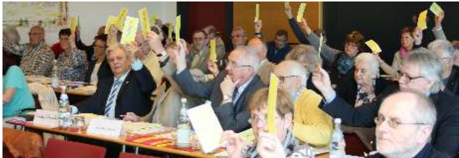
Beim Bundesseniorentag werden die Weichen in senienpolitischen Angelegenheiten gestellt.