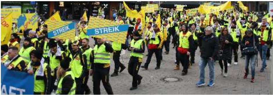
DPVKOM-Mitglieder erhalten selbstverständlich Streikgeld, auch schon bei einem Warnstreik.